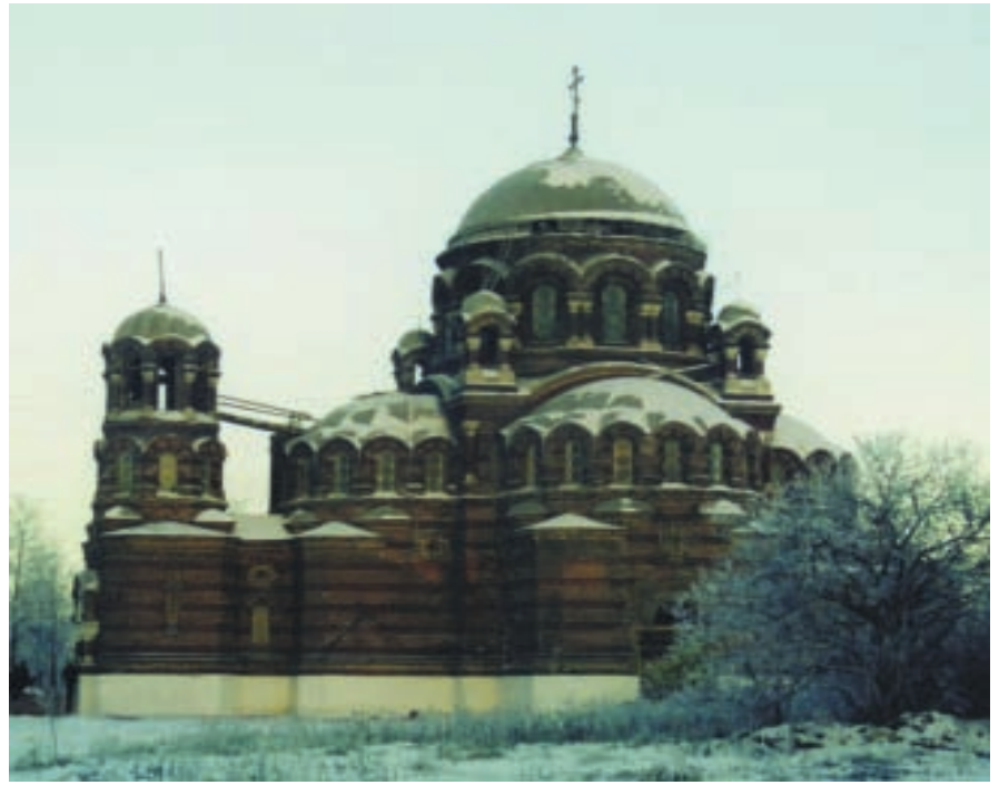
Церковь Пресвятой Троицы г. Коломна (Щурово)

Радостно, когда кто-то жертвует на нужды храма. Но при этом планировать какую-либо работу очень сложно. Только, когда у храма есть постоянные помощники, которые участвуют в жизни прихода, знают его потребности и проблемы, можно говорить о постоянной, планомерной работе. Ведь нельзя сегодня открыть Воскресную школу, а через месяц ее закрыть из-за отсутствия денег. Примером такого сотрудничества может служить ГОСУДАРСТВЕННОЕ УЧРЕЖДЕНИЕ МОСКОВСКОЙ ОБЛАСТИ «МОСОБЛГОСЭКСПЕРТИЗА», оказывающее постоянную помощь приходу церкви Пресвятой Троицы г. Коломны (Щурово).