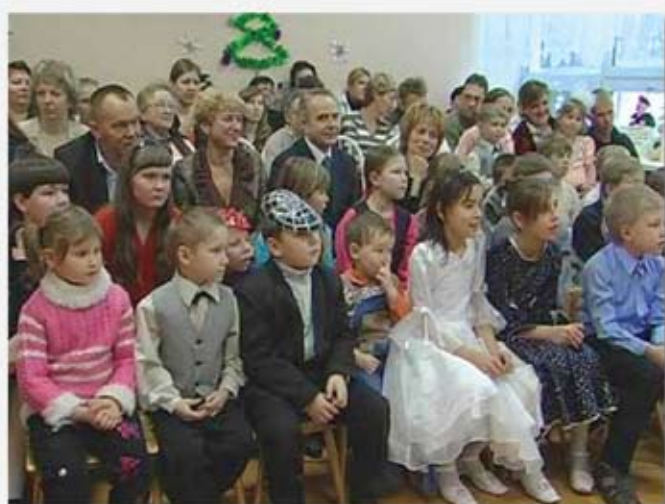
Новогодняя елка для воспитанников Социального приюта для детей и подростков «Дом доверия»

Казалось бы, кто из родителей не хочет, чтобы его ребенок был самым лучшим? Все ли мечтают об этом? К сожалению, нет. Некоторые родители не заботятся о своих детях. Пьянство, отказ от них — все это усугубляет семейное неблагополучие и болезненно отражается на детях. Из неблагополучных семей дети попадают в приют «Дом доверия». Что ждет этих ребят, кем они вырастут, как в дальнейшем сложится их жизнь? Радуется то, что есть отзывчивые люди, которые не хотят остаться в стороне, быть равнодушными к «чужим» детям. В течение года в «Доме доверия» работают 5 семейных воспитательных групп. В каждой группе находятся от одного до трех воспитанников. Здесь работают те люди, которые, имея собственных детей, берут на воспитание «чужих», даря им родительскую любовь, ласку, заботу. Они искренне хотят сделать их счастливыми, согреть в материнских объятиях».